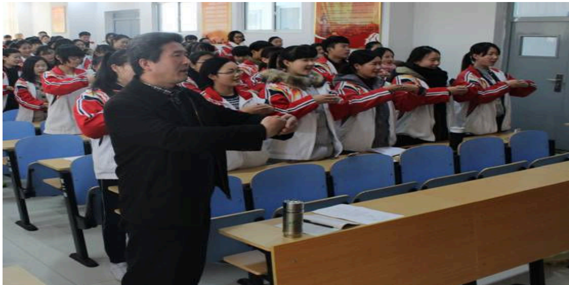
图 7-2-5 我校师生一起学习中华传统礼仪