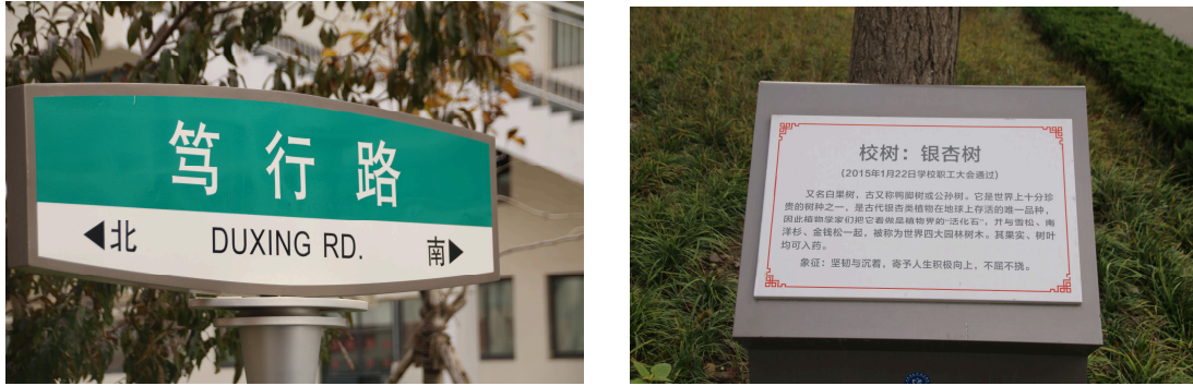
图 7-3-11 校园标识、提示

规范安全行车。通过道路指示牌，如明德路、南丁格尔路、阳光路、学思路、笃行路、诚信路等，以及承受台说明牌，国旗、校旗说明牌，校花、校树、古树介绍牌，详细介绍学校重点景观、设施等的文化寓意，从而精心营造育人氛围。