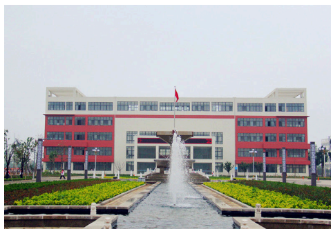
图 7-3-3 承受台

近年以来，学校继续按照科学规划，精心设计，注重品位，突出特色的原则，通过加强绿化、亮化、净化、文化等“四化”建设，努力建设整洁、高雅、富有教育意义的校园文化特质载体，切实提升环境育人效能。