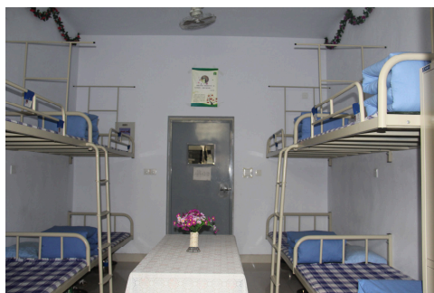
图 7-3-7 学生宿舍