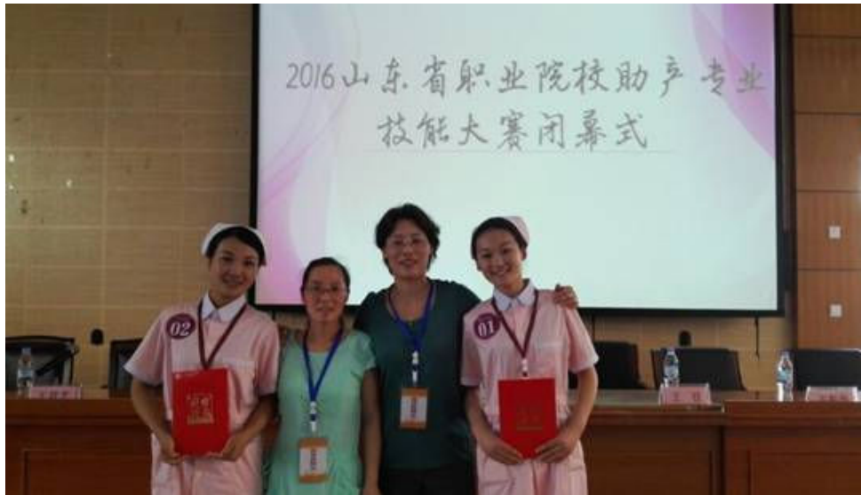
图 7-1-3 2016 年山东省职业院校助产专业技能大赛 我校获奖选手与指导教师