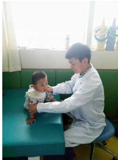
图 4-2-2 实习生风采