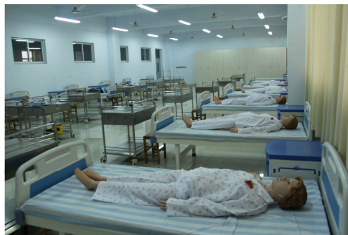
图 7-3-6 学生实训室