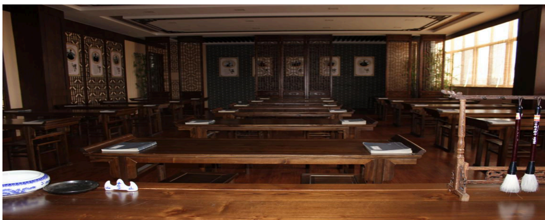
图 7-2-1 国学堂