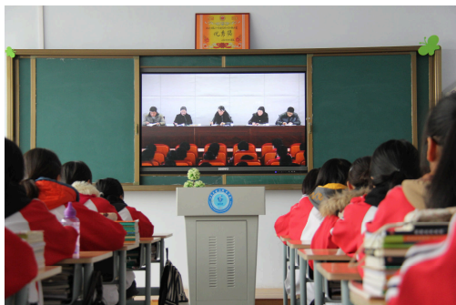
图 7-3-5 学生教室

（三）净化。健全卫生保洁制度，增强师生环保意识，培养文明卫生习惯；彻底清理校园内建筑、生活垃圾、砂土石堆、煤堆及卫生死角，校园、教室、宿舍卫生坚持日打扫、日检查、日评比，做到墙面无污痕、桌面无刀痕、地面无污水、室内外无纸屑、无蛛网积尘、无垃圾、物品摆放整齐，确保校园、教室、实验室、办公室、宿舍、厕所、食堂操作间和餐厅及其他师生活动场所和各类设施干净、整洁、有序。