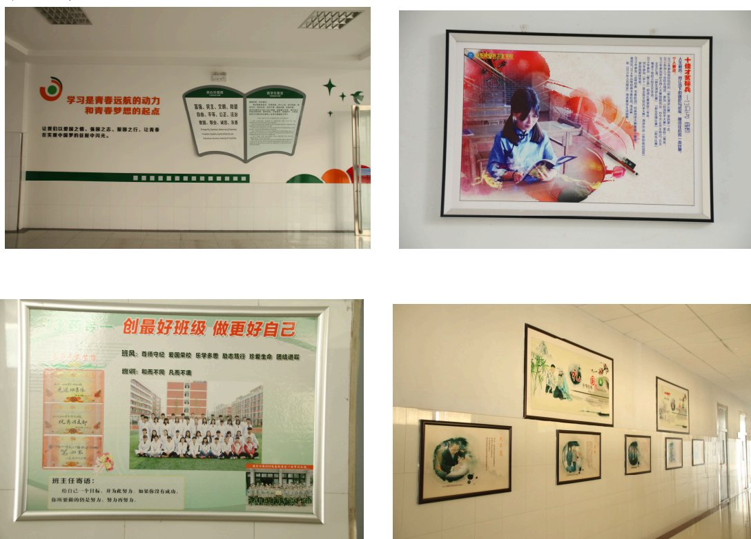
图 7-3-10 楼厅、走廊文化

(3) 学校餐厅围绕文明用餐、勤俭节约、卫生安全、色香味美、健康搭配等方面，努力创建“文化餐厅”、“文明餐厅”，并针对学生的思想特点，通过修身格言、宣传画等倡导健康饮食、节能节约等理念，把宣传教育巧妙地引入学生生活的细节和点滴之中，让广大学子在课堂之外读到另一本“书”。