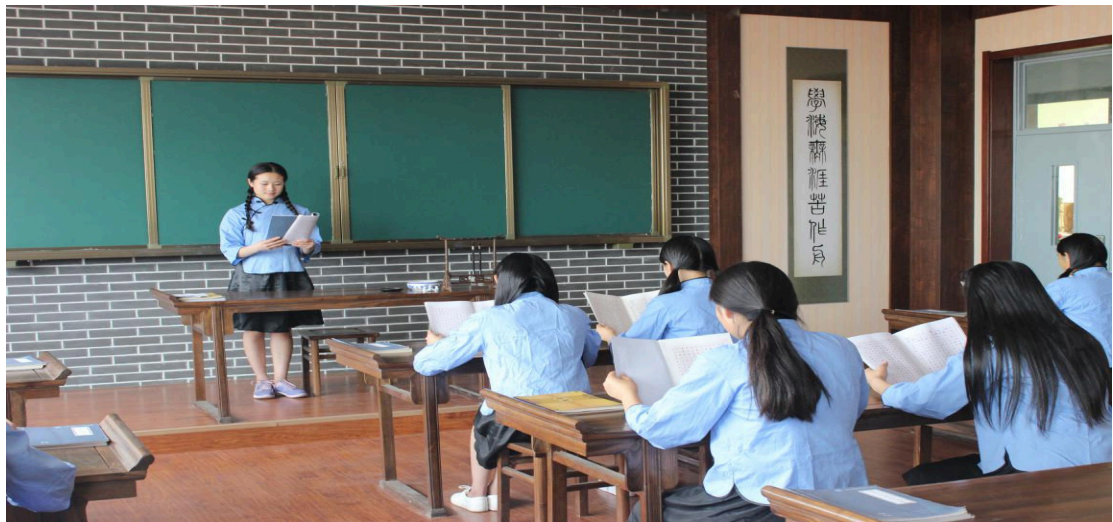
图 7-2-6 我校经典诵读社团社团活动