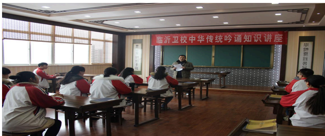
图 7-2-4 中华传统吟诵知识讲座