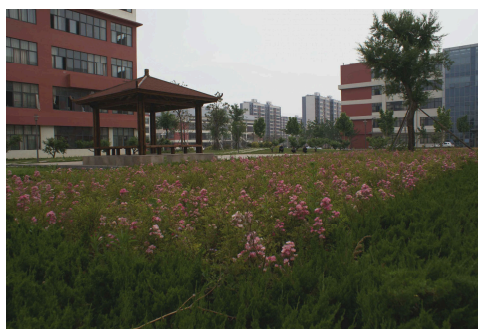
图 7-3-4 校园绿化一角

（二）亮化。通过校内人行道两侧的路灯亮化校园；在楼道、楼梯口、餐厅、卫生间等学生活动密集场所，安装指示灯、路灯，既达到亮化目的，又保障师生安全；经常对学校电路、照明设施及大功率用电器使用情况进行检查，确保