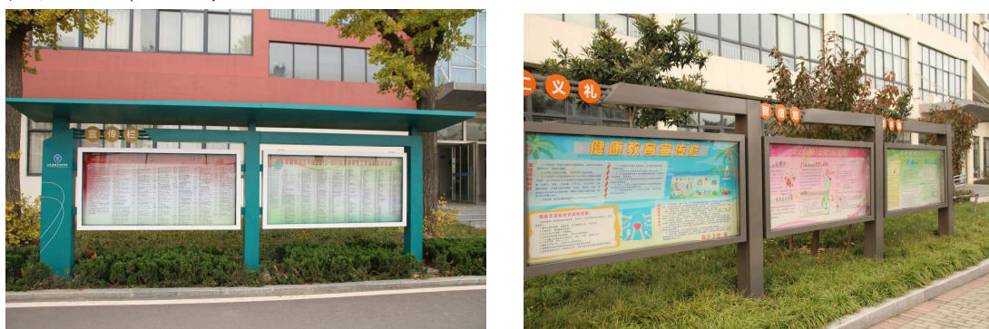
图 7-3-9 宣传栏

1. 校园宣传、文化设施。在校园醒目位置有体现学校办学宗旨、办学理念、办学目标、校训、校风、教风、学风的宣传牌，各种标牌设置美观、精致。充分利用阅报栏、宣传栏、板报、橱窗等，宣传时事新闻、学校动态、教学成果、德育实践，表彰优秀教师、三好学生、优秀团员、优秀毕业生先进事迹，普及专业知识、健康生活知识、疾病预防知识和安全常识等。