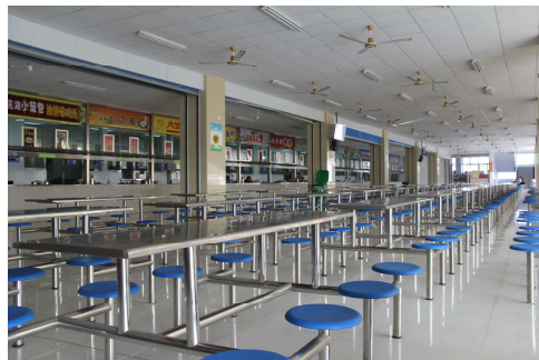
图 7-3-8 学生餐厅

（四）文化。学校通过校园宣传、文化设施，楼宇厅廊、室内文化设施，校园标识、提示系统等载体，体现公民道德规范、职业道德要求、素质教育目标、课程改革理念、人文精神培养、终身发展需要、传统文化经典等内容，大力营造校园文化氛围。