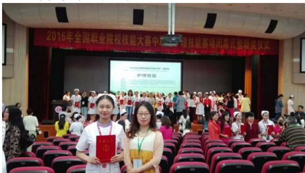
图 7-1-1 2016 年全国职业院校技能大赛中职组护理技能大赛 我校获奖选手与指导教师