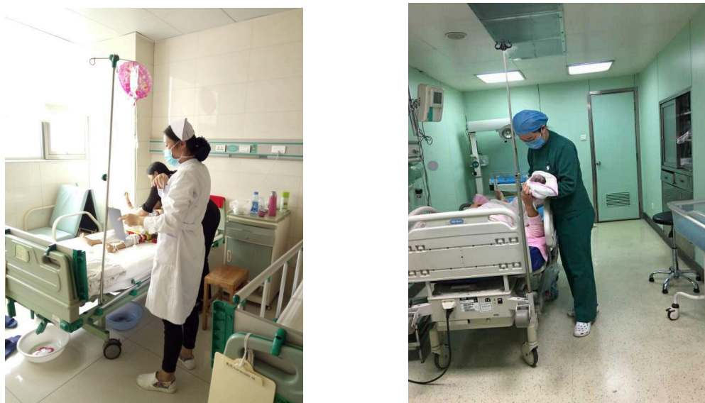
图 4-2-1 实习生风采

学生在实习医院和企业实习得到广泛认可和一致好评，部分优秀学生实习结束后直接被实习单位录用。学校负责统一安排顶岗实习，2016 学年度，学校共安排实习学生 1445 人，其中大专班学生 1024 人，中专班学生 421 人，药剂专业带薪实习学生 86 人。