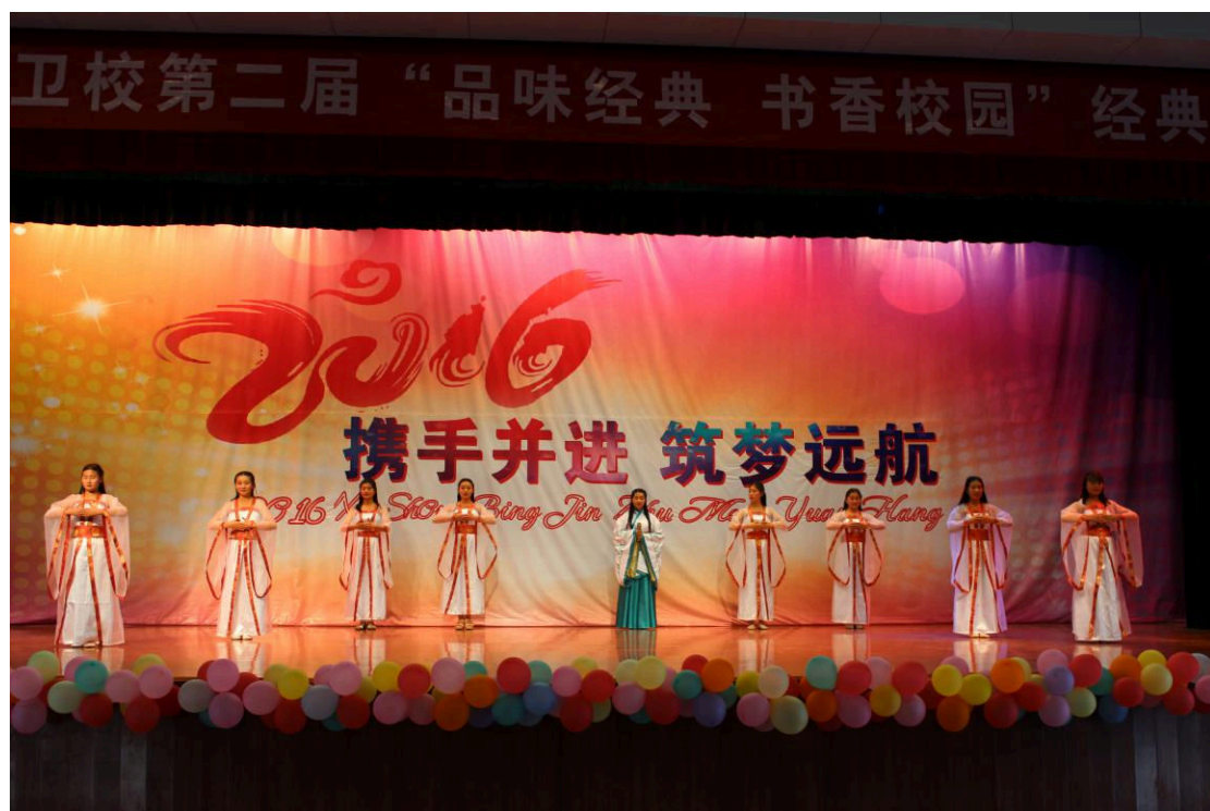
图 7-2-9 我校第二届“品味经典 书香校园”经典诵读比赛