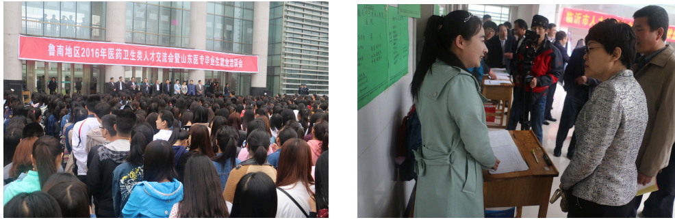
图 2-5-1 2016 招聘会现场

4. 在创新创业能力方面，学校继续大力开展创业能力培训，共培训学员 5 期，10 个班次、331 人次，全部学员均通过结业考试，获得创业能力培训合格证书。