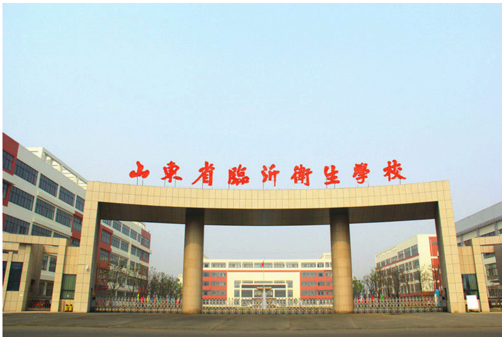
图 7-3-1 学校大门

区。新校园规划建设合理，建筑设计新颖，功能分区科学，环境整洁优美，现代教育理念与厚重人文底蕴紧密结合，翰墨飘香，设施一流。主要有主题广场景观区、教育教学景观区和休闲运动景观区。主题广场景观区为校园主入口区，主要包括校门建筑、承受台、国旗台、明德广场等。教育教学景观区包括南丁格尔大道，校史文化园，以及教学楼、实验楼围合的沁园、慧园等。休闲运动景观区宿舍区为学生的主要休息场所，建设有玉兰园等庭院，整齐的绿地、小广场与休闲座椅结合，玉兰树和常绿乔木、小灌木的搭配，采用了现代简洁的布局形式，营造一个干净的氛围。宿舍区旁边是学校的运动场地，建有标准的 400 米塑胶跑道田径场和人工草皮足球场，全封闭的高标准篮球场、排球场和乒乓球活动场所等。