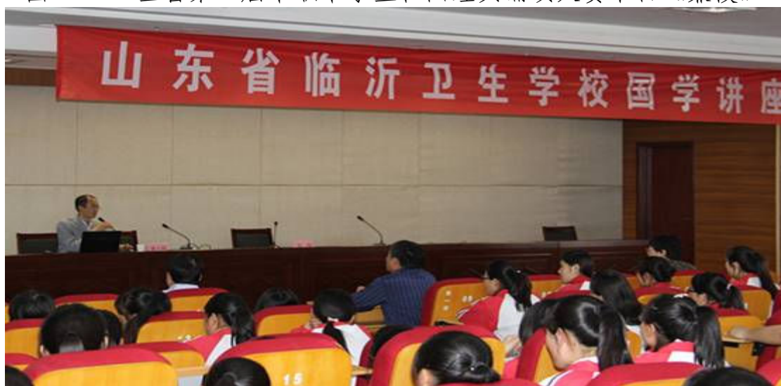
图 7-2-8 国学讲座