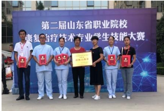
图 2-5 山东省康复治疗技术技能大赛