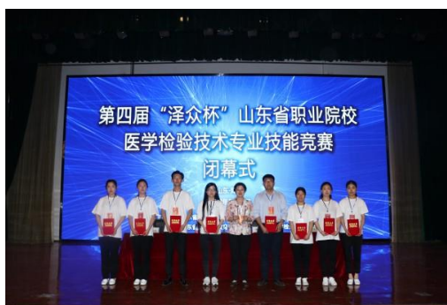
图 2-1 山东省学检验技术专业职业技能竞赛

2.5.2 加强学生专业技能训练，养成良好的职业素养。 我校积极参加、承办各校外项职业技能大赛，在各项各级技能大赛中屡获佳绩，达到了以赛促练、以赛促学的教学效果。