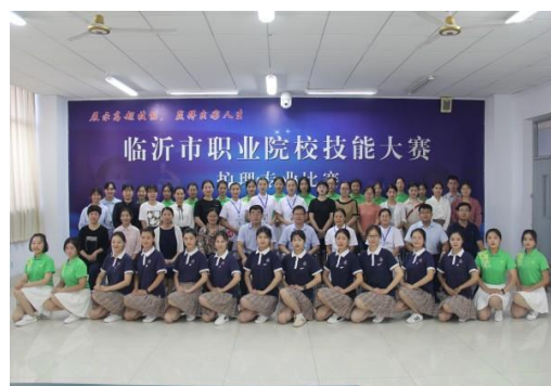
图 2-4 临沂市护理专业技能大赛