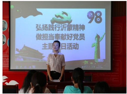
教务二支部微党课