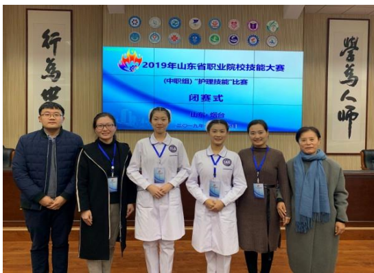
图 2-7 山东省护理专业技能大赛