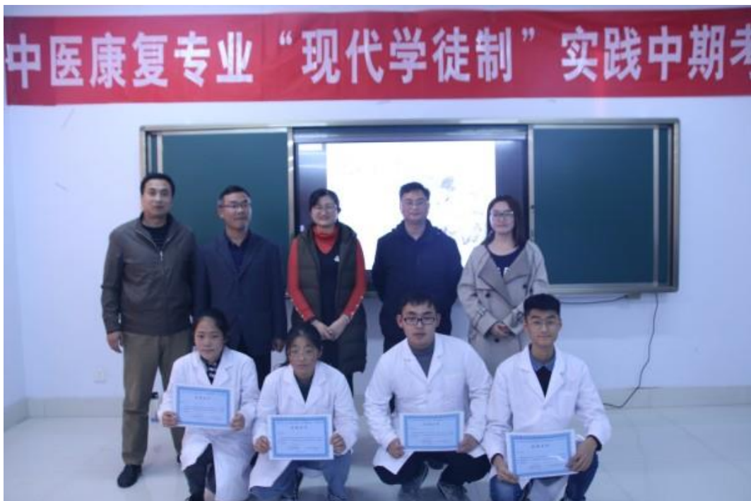
颁发中期考核合格证