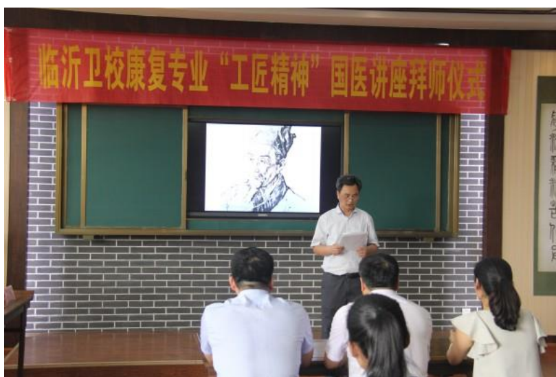
我校举行拜师仪式