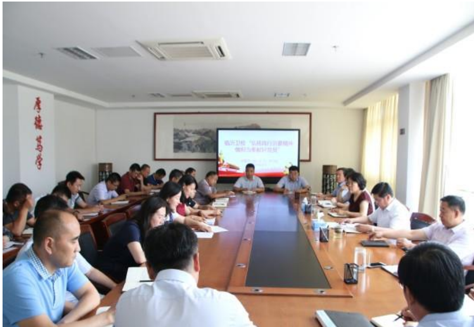
“弘扬践行沂蒙精神 做担当奉献好党员”党委中心组（扩大）学习会

围绕“弘扬践行沂蒙精神”，组织一次理论中心组专题学习研讨；各党支部开展研讨交流，组织党员谈认识、讲体会、议发展、定措施，每位党员认真撰写了以“弘扬践行沂蒙精神争做担当奉献好党员”为主题的研讨材料，形成全员参与、广泛研讨、深化认识、提升境界的浓厚氛围。