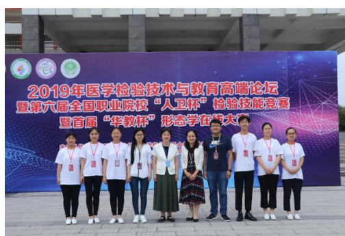
图 2-2 全国检验技能竞赛