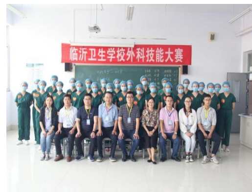
图 2-8 校级外科技能大赛

2.5.3 通过就业主题班会、就业知识讲座、小型招聘专场、校内模拟招聘大赛等活动有效锻炼学生的学习能力、岗位适应能力和岗位迁移能力。