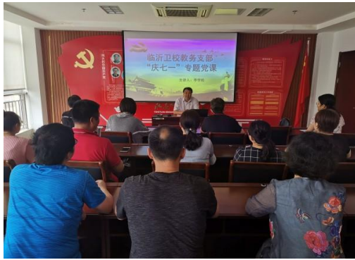
教务党支部专题党课