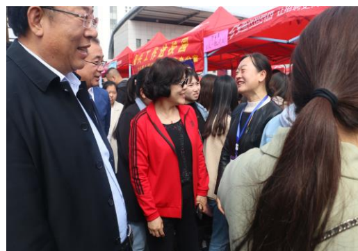
图 2-10 2018 年招聘会