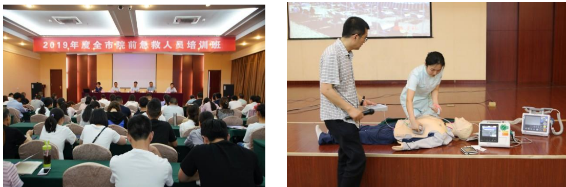
图 5-1 120 岗前急救培训授课现场

5.2.2 发挥我校专业优势，积极参与各项社会活动。作为牵头单位承担兰山区中药资源普查工作；我校南丁格尔志愿服务队，承担在临沂商城国际博览中心举办的第四届中国（临沂）国际玩具产业及婴童用品博览会救护保障工作；学校组织义诊医疗队，深入蒙阴岱崮镇坡里社区开展义诊医疗服务，并多次组织职工参加社区志愿服务活动。