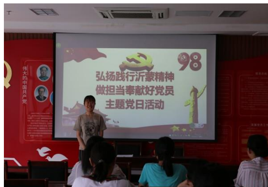
开展“弘扬践行沂蒙精神，做担当奉献好党员”主题党日活动

各党支部以“弘扬践行沂蒙精神”为主题，开展主题党日活动，活动主题鲜明、准备充分、内容详实、成效明显。