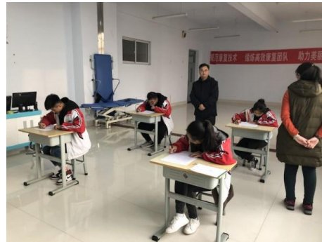
中期考核之实践技能操作