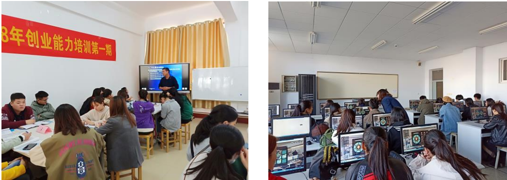
图 2-11 创业培训授课现场

2.5.4 在创新创业能力方面，学校继续大力开展创业能力培训，共培训学员1期，52人次，共有41名学员通过结业考试，获得创业能力培训合格证书。比上年度培训人员略有减少。