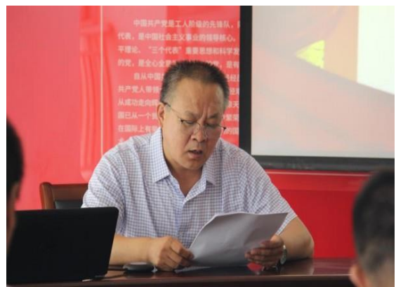
各党支部开展研讨交流活动