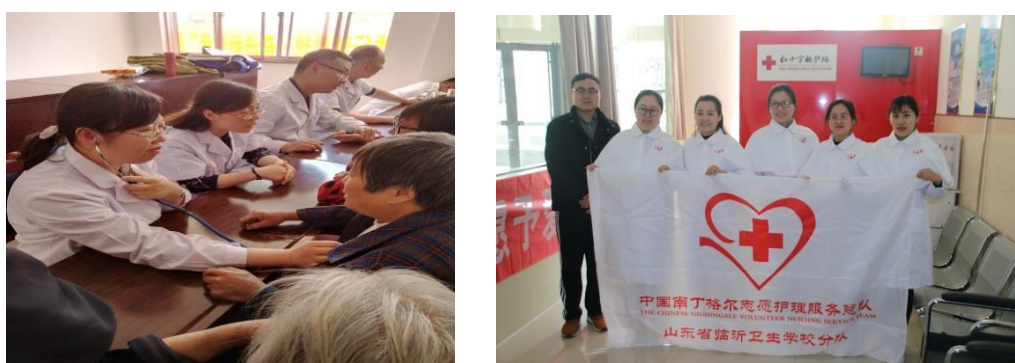
图 5-2 学校专业教师参加义诊及志愿服务活动

5.2.2 发挥我校专业优势，积极参与各项社会活动。作为牵头单位承担兰山区中药资源普查工作；我校南丁格尔志愿服务队，承担在临沂商城国际博览中心举办的第四届中国（临沂）国际玩具产业及婴童用品博览会救护保障工作；学校组织义诊医疗队，深入蒙阴岱崮镇坡里社区开展义诊医疗服务，并多次组织职工参加社区志愿服务活动。