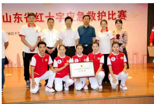
图 2-3 山东省红十字应急救护比赛