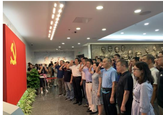
到上海中共一大旧址进行党性教育