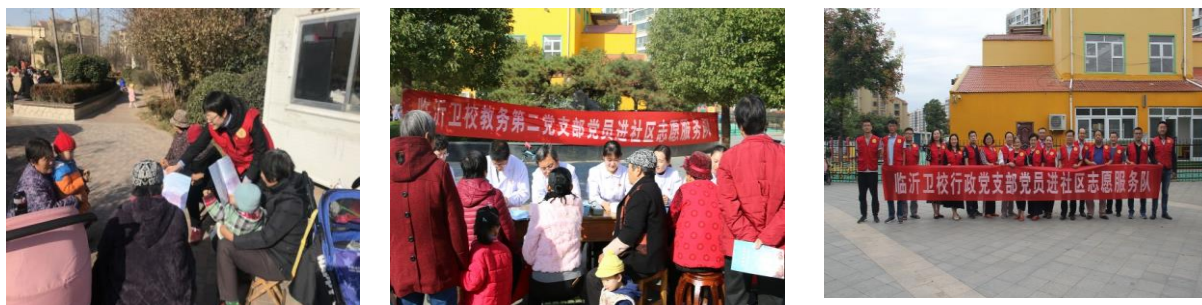
各党支部进社区“双报到”志愿服务活动