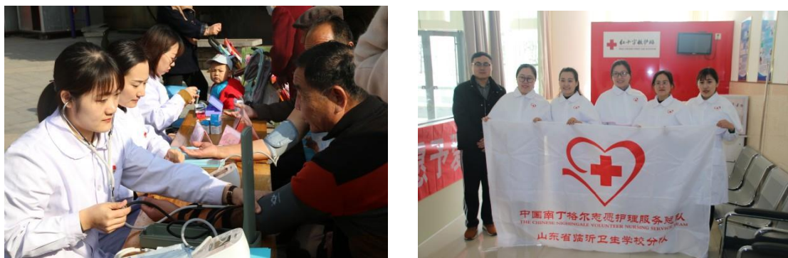
图 5-3 学校专业教师参加义诊及志愿服务活动

5.2.3 发挥我校专业优势，积极参与各项社会活动。 作为牵头单位承担兰山区中药资源普查工作；我校南丁格尔志愿服务队，承担在临沂商城国际博览中心举办的第四届中国（临沂）国际玩具产业及婴童用品博览会救护保障工作；学校组织义诊医疗队，深入蒙阴岱崮镇坡里社区开展义诊医疗服务；临沂卫校“七彩沂蒙”养老照护志愿服务队于2019年9月中秋节前开展了“情暖中秋 关爱老人”中秋慰问活动；学校参加“世界急救日”应急救护主题演练等活动，并多次组织职工参加社区义诊志愿服务活动。