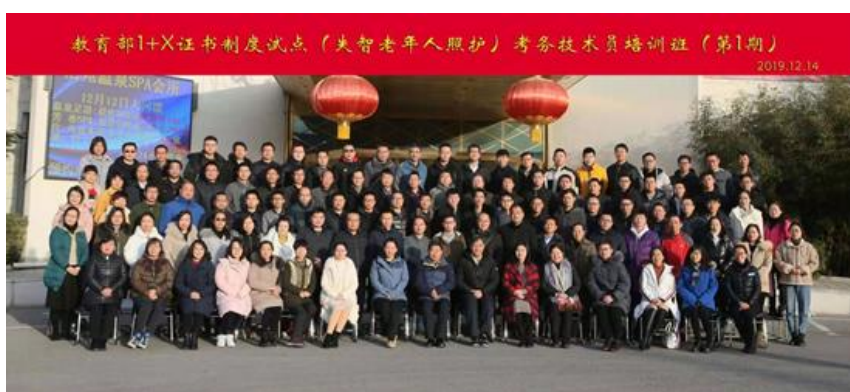
图 2 第 1 期教育部 1+X 证书制度试点考务技术员培训班