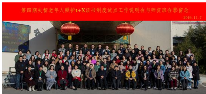
图 1 第四期失智老年人照护 1+X 证书制度试点工作说明会与师资班

评员资格。同时积极参加山东省 1+X 证书制度试点论坛，以及失智老年人照护专业教师国家级培训。