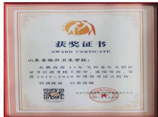
图 9 我校获得优秀试点院校