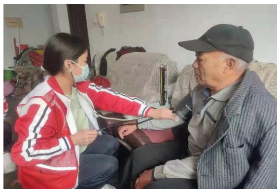
图 3-17 志愿者为老人测血压

3.5.6.2 继续开展社区刮痧志愿服务。我校“天使刮痧”服务队，利用周末前往附近社区和村庄进行义诊活动，为村里居民免费提供问诊、刮痧、针灸、拔罐、推拿、艾灸等服务，为居民缓解病痛。同时，联合临沂市红十字会组织志愿者到临沂市老年养护院为老人开展刮痧义诊服务；积极开展暑期“三下乡”社会实践活动，在乾沂庄、曹家王平等社区开展实践活动，为村民实施刮痧、按摩、测量血压、血糖等操作，累计服务群众 200 余人次，得到了社区居民的一致好评。