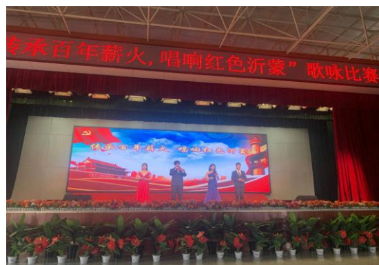
图 3-5 主题歌咏比赛

3.5.3.2 继续开展社会主义核心价值观系列教育活动。利用升旗仪式、国旗下讲话、微信公众号、校园广播、心灵驿站、展板宣传等方式，围绕沂蒙精神、劳模精神、工匠精神、诚实守信、文明礼仪、感恩励志、勤俭节约、校园安全和防溺水安全等多个层面对广大学生进行有针对性的熏陶和教育。