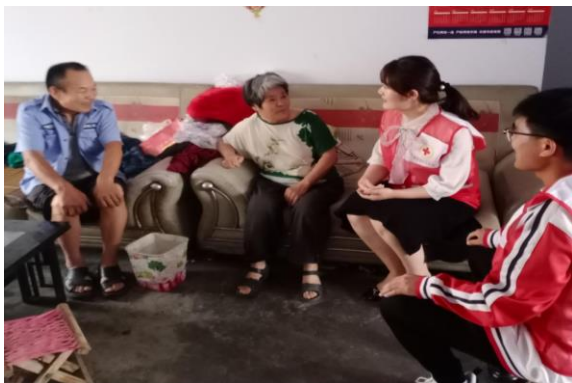
图 3-16 “七彩沂蒙” 志愿服务