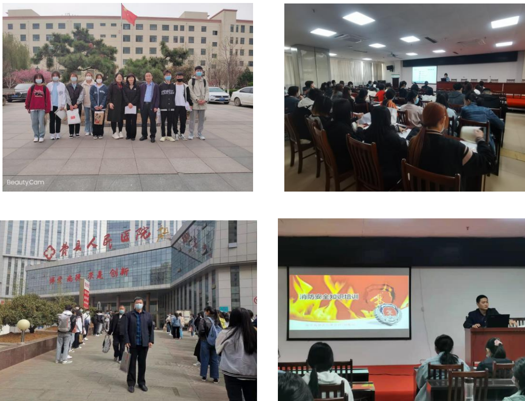
图 4-1 学生实习检查、安全培训照片

通过加强院校（校企）合作协同育人模式，我校实习生毕业率和就业率稳步增加，近几年有 200 多名学生实习结束后直接被实习单位录用，有多名同学成为单位的骨干力量。