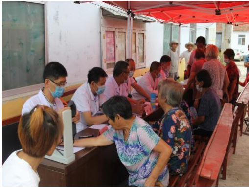
图 6-2 义诊活动现场