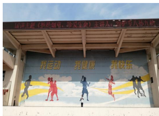
图 3-7 《拒绝烟草, 珍爱生命》

3.5.3.3 共青团山东省临沂卫生学校第八次代表大会于 2021 年 1 月 10 日隆重召开。学校团委充分体现团员先进性，严把入团关，举办了两期入团积极分子培训班，共吸收 294 名优秀青年加入到团组织中，并为新团员举办入团宣誓仪式，壮大了学校团组织队伍。