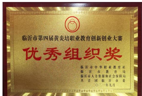
图 2-5 在临沂市第四届黄炎培职业教育创新创业大赛中获得优异成绩