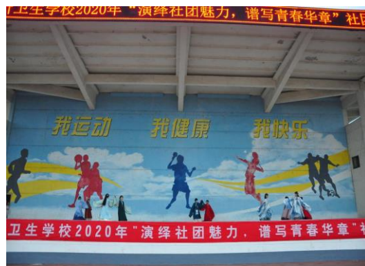
图 3-13 社团节目表演

3.5.4.4 积极参与上级部门组织的各种活动。我校报送的《我们一起学党史》、《百年华诞的非遗献礼》、《信仰永恒》、《写给 2035 年的我》等作品，在山东省教育厅、山东省职教学会等部门组织的山东省中等职业学校“少年工匠心向党 青春奋进新时代”活动中分别荣获一、二、三等奖；选送的朗诵作品《朗诵者之歌》，获临沂市教育局组织的临沂市中华经典吟诵大赛二等奖；选送的舞蹈作品《逆行的爱》，在山东省中小学校园艺术节舞蹈器乐专项展示活动中参展；团委组织参加临沂市社团文化艺