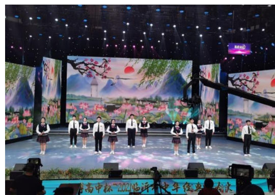
图 3-11 参加临沂市经典诵读比赛