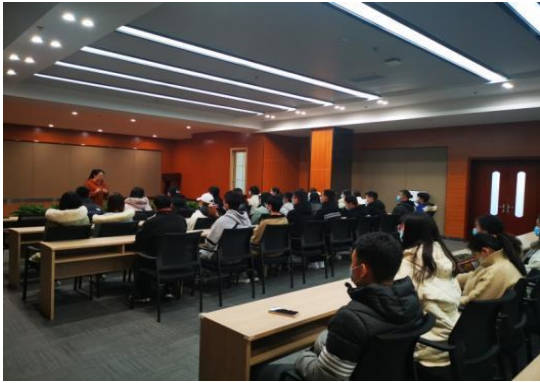
图 2-3 2021 年 4 月组织学生参加招聘会“老年养护院”招聘专场