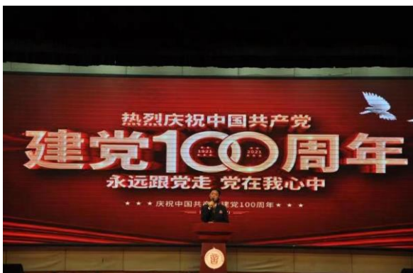
图 3-4 主题演讲比赛