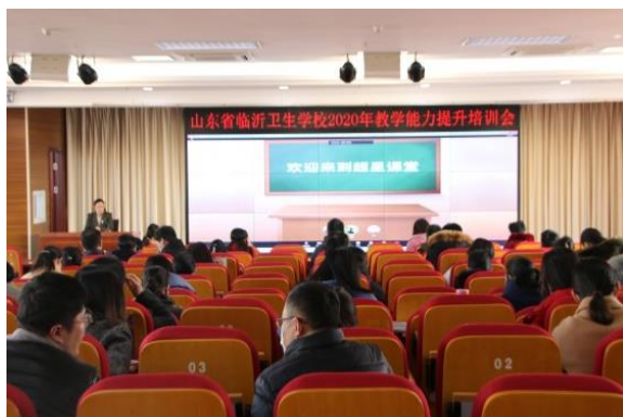
图 3-1 教学能力提升培训