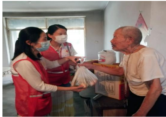
图 6-3 志愿者探望独居老人