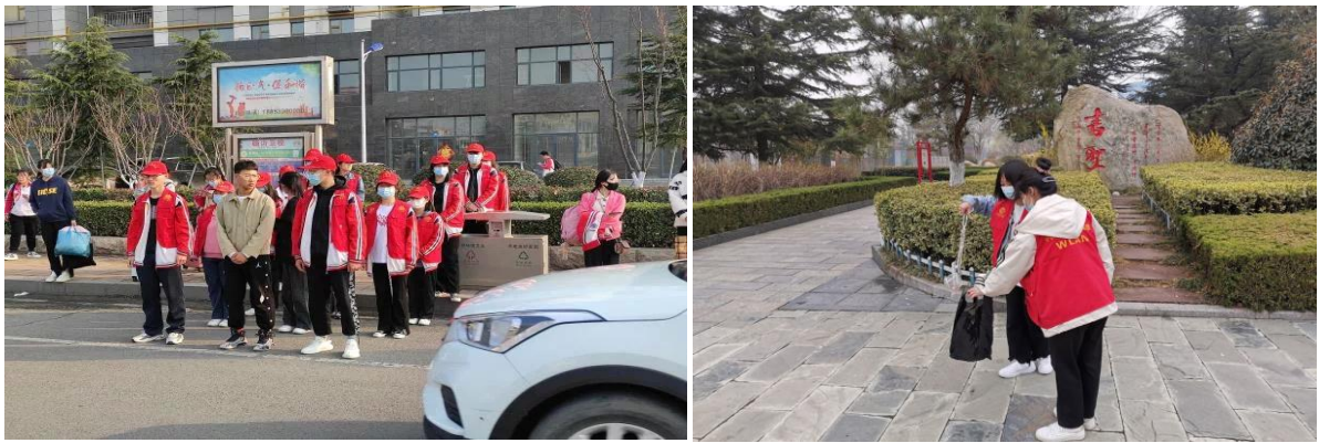
图 3-20 志愿者维护乘车秩序

多次组织志愿者外出开展志愿服务，一是在学校附近的公交站牌处维持乘车秩序，引导乘客文明候车按序排队；二是组织志愿者在书法广场开展“守护蓝天卫士”志愿服务，认真清理广场内的杂草和垃圾，以实际行动为营造“新临沂”的美好环境贡献了力量。