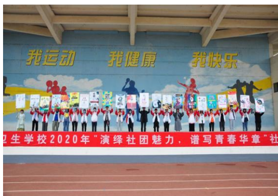
图 3-12 2020 年社团文化节

3.5.4.3 圆满完成学生社团纳新工作。纳新活动共有 24 个社团参与，通过节目表演、条幅海报、作品展示等多种形式，各社团展示自己的风采、吸引同学们的加入，在丰富学生课余生活、促进我校校园文化建设等方面发挥着重要的作用。