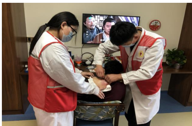
图 3-18 志愿者为老年人刮痧服务

3.5.6.2 继续开展社区刮痧志愿服务。我校“天使刮痧”服务队，利用周末前往附近社区和村庄进行义诊活动，为村里居民免费提供问诊、刮痧、针灸、拔罐、推拿、艾灸等服务，为居民缓解病痛。同时，联合临沂市红十字会组织志愿者到临沂市老年养护院为老人开展刮痧义诊服务；积极开展暑期“三下乡”社会实践活动，在乾沂庄、曹家王平等社区开展实践活动，为村民实施刮痧、按摩、测量血压、血糖等操作，累计服务群众 200 余人次，得到了社区居民的一致好评。