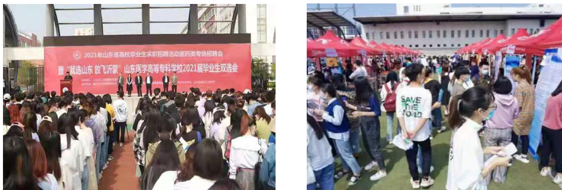
图 2-2 2021 年 5 月组织学生参加“就选山东 放飞沂蒙”毕业生招聘会

2.5.3 通过就业主题班会、就业知识讲座、专场招聘双选会、校内职业规划大赛等活动有效锻炼学生的学习能力、岗位适应能力和岗位迁移能力。