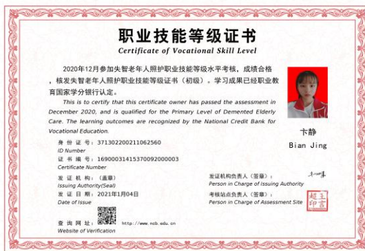
图 8 学生获得的职业等级证书

在积极申报试点学校，组织学生培训的同时，我校成功申报了考评点。我校已参加了 2019 年、2020 年两批次失智老年人照护试点考试。最终有 280 人通过并取得失智老年人照护初级证书。我校五位老师分别获得“优秀师资”和“优秀考评员”荣誉称号。2020 年学生考试通过率为百分之百，并获得“优秀试点院校”荣誉称号。目前正在进行第三批次学生培训，即将参加 2021 年全国第四次统一考试。