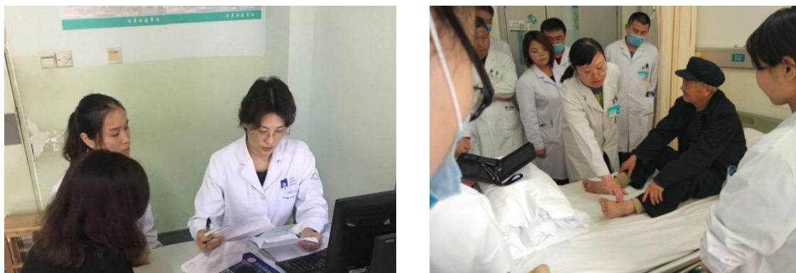
图 6-1 我校教师在医院从事临床实践工作

6.2.2.1 鼓励教师到企业和临床医院就职。目前，我校共有36名临床教师常年在临沂市人民医院、临沂市肿瘤医院、临沂市妇女儿童医院、兰山区人民医院等从事临床实践工作，其中有8人担任医院的科室主任、副主任从事领导管理工作。