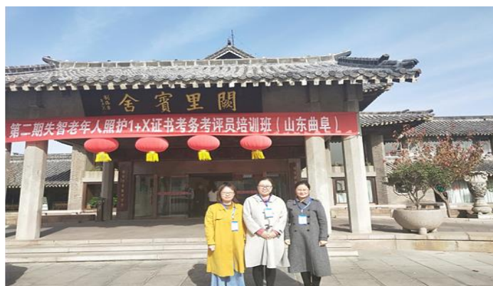
图 3: 第二期失智老年照护 1+X 证书考务考评员培训