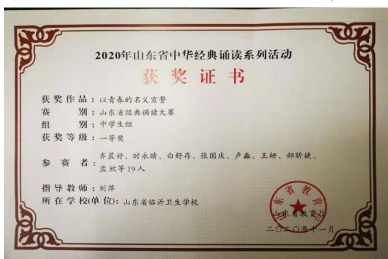
图 3-14 2020 年经典诵读优秀组织奖 图 3-15 报送作品获山东省一等奖