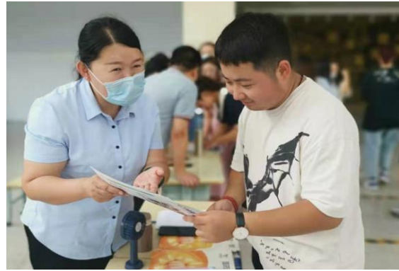
图 2-4 2021 年 7 月组织毕业生返校小型

2.5.4 在创新创业能力方面，学校继续大力开展创业能力培训，共培训学员 1 期，46 人次，共有 33 名学员通过结业考试，获得创业能力培训合格证书。比上年度培训人员持平。