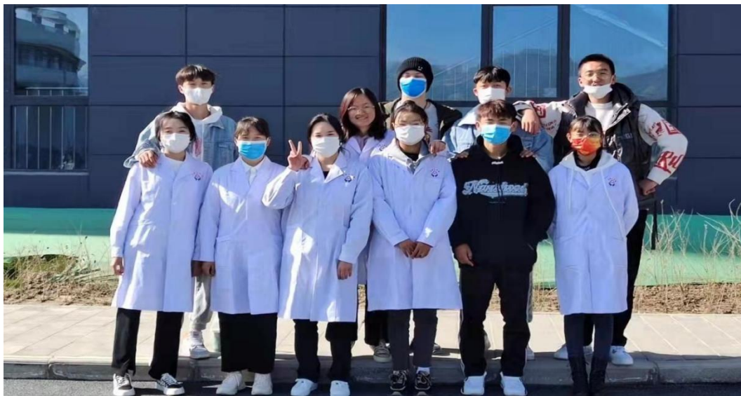
图 6-4 学生单招考试合影

毕业后，班主任老师根据学生个人发展规划，积极鼓励同学提升学历，并指导学习方法，搜集考试资料，最终 13 人顺利通过单招考试，其中，青海卫生职业技术学院 11 人，西安思源学院 1 人，西安高科学 1 人。