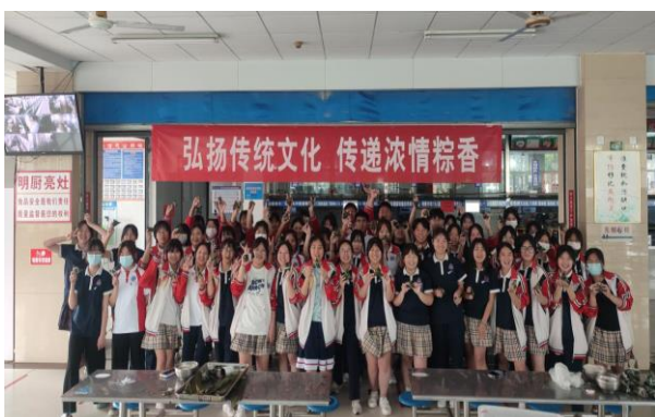
图 3-10 端午节包粽子活动

3.5.4.1 大力推广国学教育。学校积极举办第六届“品味经典 书香校园”经典诵读比赛，同时利用清明、端午等时间节点积极开展教育活动，如“弘扬传统文化 传承中华美德”主题班会、组织学生包粽子等，让同学们进一步了解我国优秀传统文化，增强文化自信。