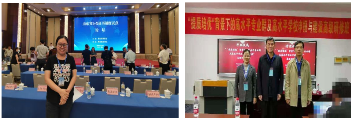
图 3-3 我校教师参加培训

学校鼓励和支持教师参加各级各类专业技能比赛，先后共有 35 人次在市级以上比赛中获奖，进一步提升了专业水平和教学能力，促进了三教改革和全员育人的落实。