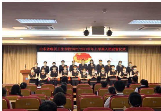
图 3-9 入团宣誓仪式

3.5.3.4 组织学生踊跃参加团省委“青年大学习”网上主题团课，深入学习宣传贯彻习近平新时代中国特色社会主义思想、党的十九大精神和十九届二中、三中、四中、五中全会和团的十八大精神。