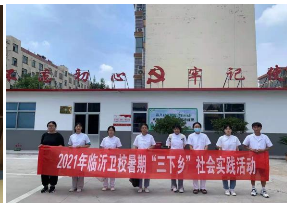
图 3-19 暑期“三下乡”志愿活动

3.5.6.3 定期开展“清洁家园”志愿服务活动。在校园内随处可见志愿者认真清扫校园内的街道、楼道、宣传栏等卫生死角；