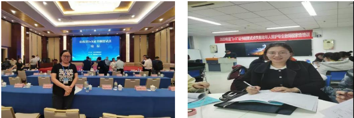
图 4 1+X 失智老年照护国家级教师培训和山东省 1+X 论坛

2. 制定培训计划方面：根据职业技能等级证书标准，在分析现有教学情况基础上，对接岗位核心技能和学历专业核心课程要求，进行课证融合，培训内容在先修基础专业课程的基础上，结合我校《老年社区护理与保健》课程和 1+x 失智老年照护证书考核标准，确定免修、强化、补修的部分，制定学校的培训计划。由于上课时间在课余和周末，考虑学生学习状态，确定小学时上课，每次课时间为 30 分钟，并计划上课时数。