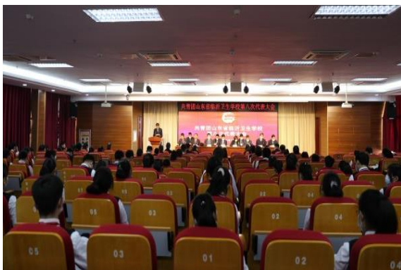
图 3-8 学校召开第八次团代会