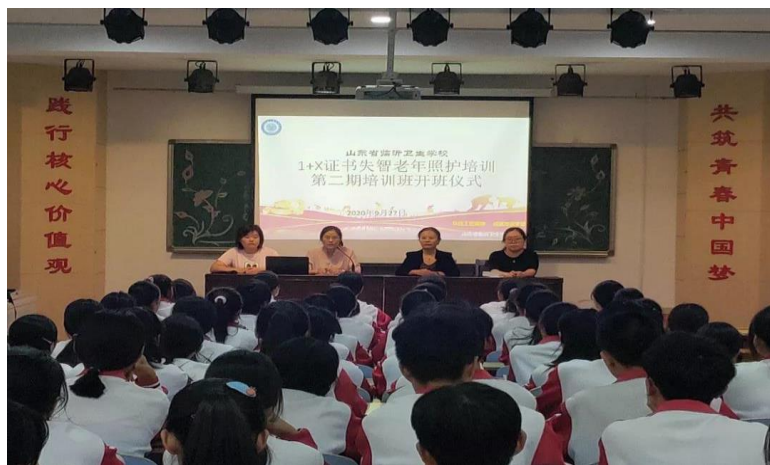
图6 第二期失智老年照护培训开班仪式

3. 注重学生临床见习，渗透职业精神。在开展培训时，规范化流程，比如强化开班仪式、增加模拟考试，增强学习的仪式感和学生学习的竞争性。培训形式以集中理论培训、校外见习教学为主。学校利用周末时间安排学生到临沂市荣军医院老年科进行临床见习。组织学生去对口实习基地进行临床见习，培养职业意识，增添思政元素，对于引导学生将来走上养老护理工作岗位具有重要意义。学习形式结合使用校本教材、线上线下混合式，合理利用碎片化时间，强化补修内容。学生理论和实践相结合，高效快速熟悉失智老年人照护相关知识。