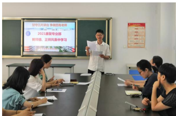
图 3-2 教学部学习师德师风

学校组织教师积极参加国家、省级、市级等校外培训，今年先后派出 150 人次教师参加市级以上各类业务培训、学术会议，重点培训一批青年骨干教师，加强专业带头人领军能力培养，