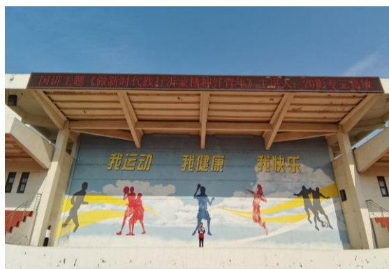
图 3-6 践行沂蒙精神国旗下讲话

3.5.3.2 继续开展社会主义核心价值观系列教育活动。利用升旗仪式、国旗下讲话、微信公众号、校园广播、心灵驿站、展板宣传等方式，围绕沂蒙精神、劳模精神、工匠精神、诚实守信、文明礼仪、感恩励志、勤俭节约、校园安全和防溺水安全等多个层面对广大学生进行有针对性的熏陶和教育。