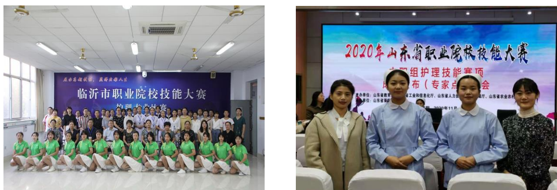
图 2-1 我校积极参加、承办各级各类职业技能大赛